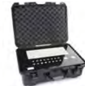
940 | Panel de aluminio pintado

Otros materiales están disponibles por solicitud.