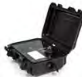
915 | Panel de Lexan